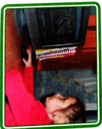
Из интернета она узнала,

что весной дятел выдалбливает себе дупло и там у него появляются птенцы.