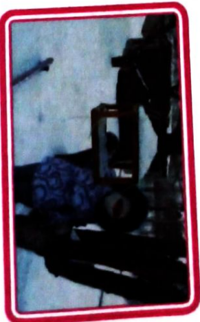
У нас на участке много деревьев, на которых висят кормушки. Дети подкармливают птиц.