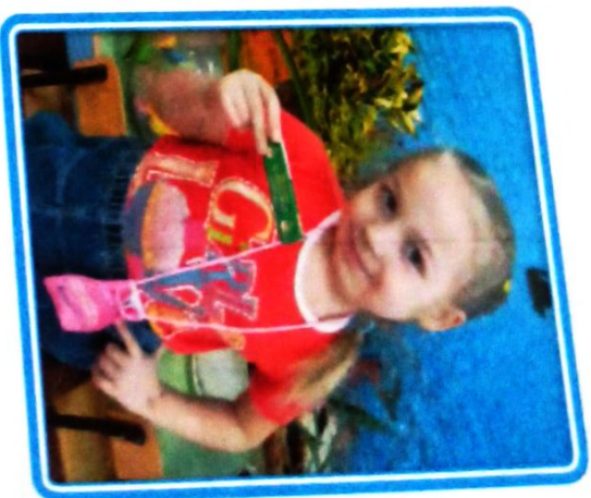
Бабушка рассказала о лечебных свойствах сосны. Для укрепления дёсен и зубов мама купила «Тайжную смолку»