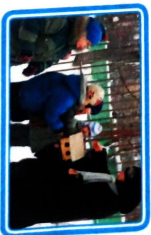
Воспитатель рассказала, что дятла называют санитаром леса, он уничтожает вредных насекомых

что весной дятел выдалбливает себе дупло и там у него появляются птенцы.