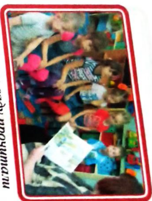
В детском саду прочитали сказку о приключениях соснового семечка.